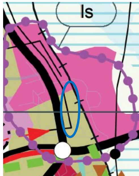
Ote maakuntakaavasta. Suunnittelualueen liikemääräinen sijainti on rajattu sinisellä.

Tiivistyvä ja kohentuva keskustaajama. Keskustaajamaa täydennetään erityisesti joukkoliikennereittien ja palveluiden läheisyydessä. Rakentamisessa kiinnitetään huomiota asuntotarjonnan monipuolisuuteen. Ydinkeskustan ja aseman seutuja täydennetään merkittävästi, tukien kävely- ja