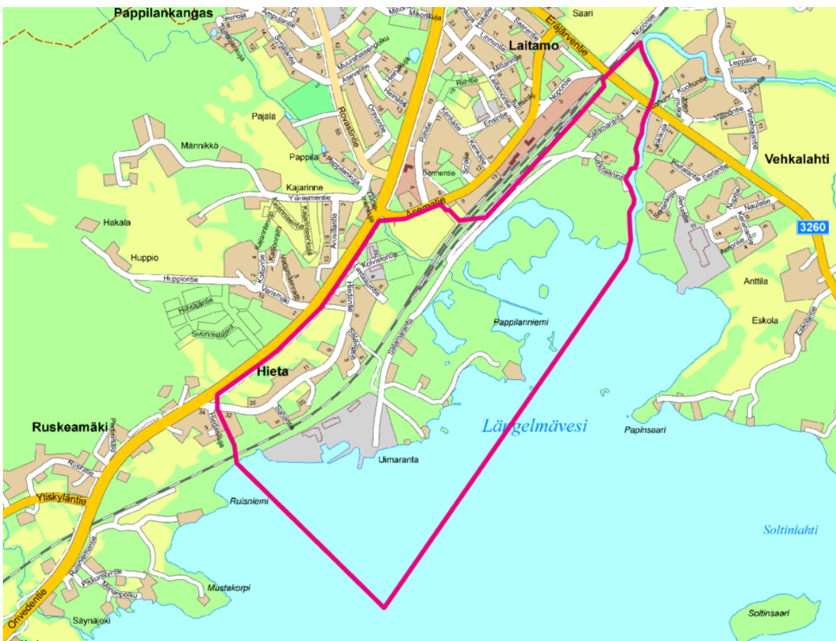
Kuva 1. Suunnittelualueen rajausta pinkillä opaskarttaphojalla.

Suunnittelualue koostuu pohjoisosan ja Hiedanmäen alueen pientaloasutuksesta, Orivedentien tuntuman teollisuuskortteleista, Hiedanrannan virkistysalueista, Pappilanniemen suojelualueesta, Längelmäveden ranta-alueista sekä toimintansa lopettaneen sahan alueesta. Aluetta halkoo yksityinen Satamarannantie sekä rautatie, jonka yhteydessä on puunkuormausalue. Kaavarunkoalueen maankäyttö on moninaista ja alueella on yhteensovittava toimintoja. Alueella on korkea kehittämispotentiaali sekä virkistysarvoja.