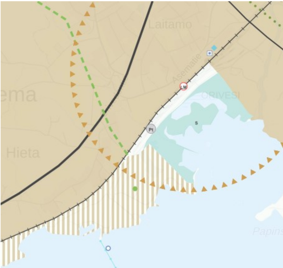
Kuva 2. Ote Pirkanmaan maakuntakaavasta 2040 Hiedan kaavarungon alueelta.

Hiedan kaavarungon alue kuuluu Pirkanmaan maakuntakaavan 2040 alueeseen. Kaavarunkoalueen pohjoisosa, Hiedanmäki sekä Asematien ympäristö kuuluvat maakuntakaavassa taajamatoimintojen alueeseen (ruskea alue). Hiedanrannan ympäristö radan eteläpuolella kuuluu ehdolliseen taajamatoimintojen alueeseen (ruskea raidoitus). Pappilanlahti on osoitettu suojelualueeksi (turkoosi alue) ja radan ympäristö alueen keskiosassa maaseutualueeksi (valkoinen alue). Lisäksi alueelle on osoitettu maakuntakaavassa useita kohde- ja muita merkintöjä: tiivistettävä asemanseutu (ruskea kolmioviivamerkintä), pohjoisosan ohjeellinen maakunnallisesti ja seudullisesti merkittävä ulkoilureitti (vihreä ympyräviiva), Lastaajantien viereinen viheryhteys (vihreä katkoviiva), Pappilanniemen virkistysalueen kohdemerkintä (vihreä ympyrä), Hiedanrannan venesatama (sinireunainen ympyrä), Mallasveden-Roineen-Längelmäveden veneväylä alueen eteläosassa (sininen viiva), rata maaliikenteellisenä alueena (LM-merkintä) sekä puuterminaali (Pt-merkintä).